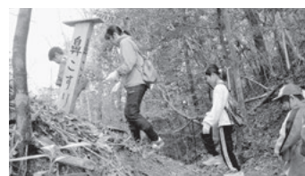
昨年のトレッキングの様子