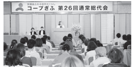
通常総代会の様子

【受付方法】 ご所属の支所にお電話いただくか、支所の地域担当者、店舗のサービスカウンター職員にお申し出ください。