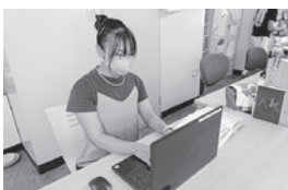
2020年度申請「特定非営利活動法人岐阜タルク」さん 就労支援のためのパソコン購入に助成

高齢者、障がいのある方、幼児・児童、その他住民の生活を支援する活動、施設作り。また、住みやすい社会づくりという目的に沿った「調査研究活動」「交流会、研究会」「シンポジウム」等の開催およびそのために必要な事業が対象です。