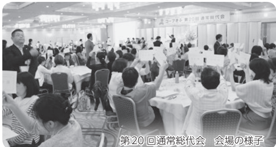
第20回通常総代会 会場の様子