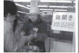
多治見店舗クラブ「おんでんさい」による鏡開きを多治見店で実施しました。

※2018年度より「コープクラブ」の位置づけや応援のあり方が変更・改善されます。