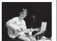
桑山氏の公演風景

生協大会は、県内の生協の組合員・役職員と一緒に学習する場です。一般の方もご参加いただけます。