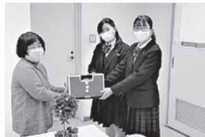
城南高校の生徒会より募金をお預かりしました