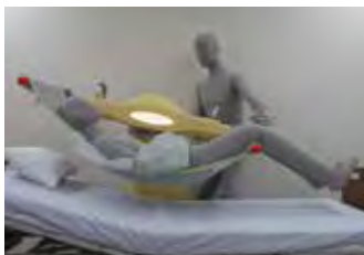
ベッドから抱き上げ(片手操作)