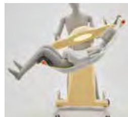
臥位~座位までの適した姿勢に調整