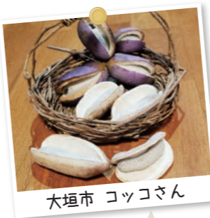
大垣市 コッコさん