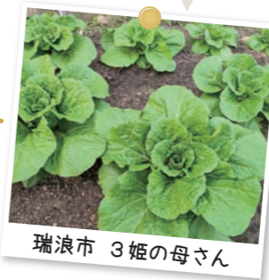
瑞浪市 3 姫の母さん

昨年に引き続き、100均で購入した種を蒔いた白菜が、今年も大きく成長しています。夫は毎朝、出勤前に顔を見に行き「大きくなれよ」「ちゃんと巻けよ」と声を掛けています。結婚した3人の娘も白菜の成長を楽しみにしています。鍋にして食べる日が楽しみです!