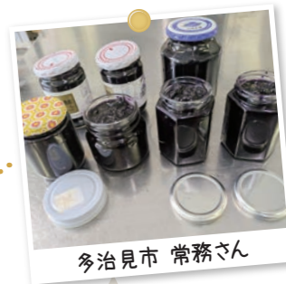
多治見市 常務さん

多治見支所フレンドクラブで、ハックルベリーのジャム作りをしました。見た目はブルーベリーに似てますが、アクがある為ジャムとして食べます。ブルーベリーより効能も良いです。