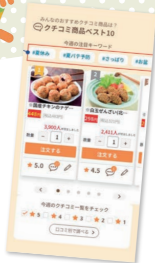
※開発中のデモ画面です。

ほかにも、注文番号での注文完了後に、注文一覧に入っている商品からレシピを提案する機能なども追加予定!