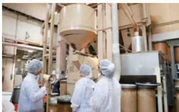
ワルツ株式会社 工場見学→