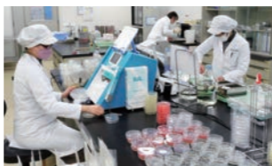
▲微生物検査の様子

たまごの食中毒で注意が必要なのは、サルモネラ菌です。生協の検査センターでは、生協たまごのサルモネラ菌の検査をしています。また、たまごのパック施設にサルモネラ菌が付着していないかを調べる「ふき取り検査」も実施しています。