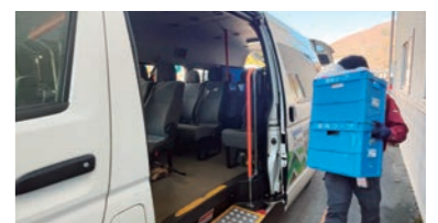
▲飛騨市貨客混載事業