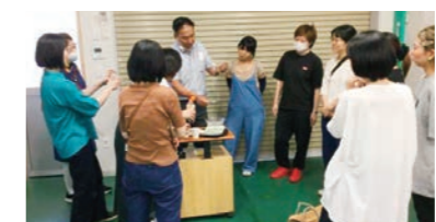
▲下呂こんにやく見学