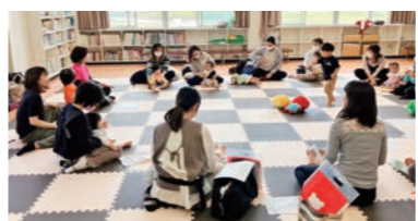
▲ベビーマッサージ