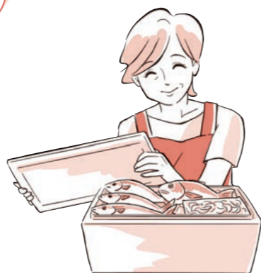
今回ご登場いただいたのは…

※きときと鮮魚ボックス…富山で水揚げされた“きとき(新鮮)”な魚を、クール便でご自宅にお届けする商品。どんな魚が届くかは開けてみてからの楽しみ♪詳しくは週刊コープぎふにてお知らせしています!