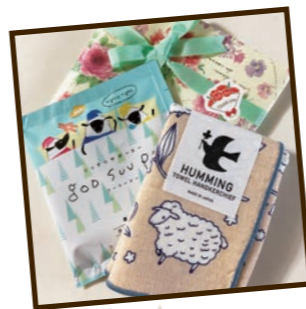
息子からの誕生日プレゼント。(50代/高山市 こあらさん)

先日、名古屋中日ビルオープン前の内覧会に行ってきました。人数が制限されていてゆっくり見る事ができました。岐阜に帰るとホッとするのですが、姉と2人で元気ならお出かけも楽しみなのでまた出かけてみたいです。7階の広場から栄の街を見てきました。(70代/岐阜市 みなみさん)