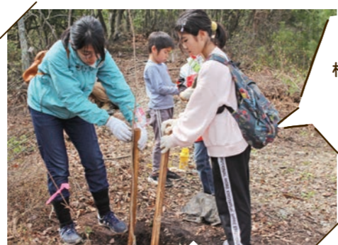
植樹した桜の木の添え木にメッセージを書きました

植樹する一帯は「ふどうの森クラブ」の皆さんが事前に整備を行ってくださり、見晴らしのよい場所に植えることができました。桜の木の添え木にメッセージを記入し、皆さん桜の木が大きくなることを願いながら植えました。3~4年も経てば、山のふもとから見てもわかる程の大きさになるとのことです。