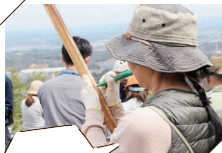
メッセージを書き中...