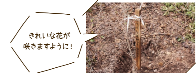
きれいな花が咲きますように!