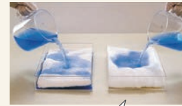
右がエアーカーおる

A エアーカーおるに用いられる特殊な燃糸 スーパーZERO は、綿の糸と水溶性の糸を通常の2倍逆に撚ってつくられています。タオルが完成後に水溶性の糸を溶解させると、隙間ができて綿の糸が撚りを戻そうと膨らむので、ふんわりとして通気性や吸水性に優れた高機能なタオルになります。