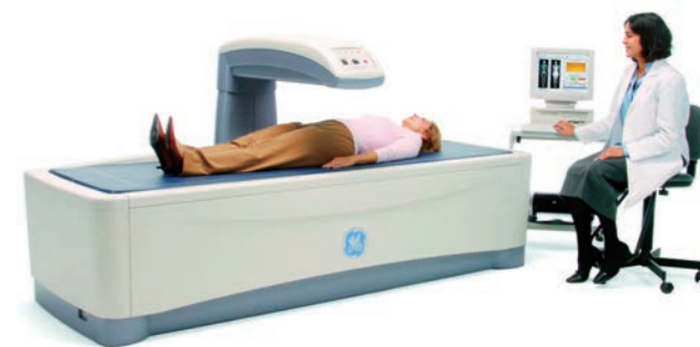
「全身用骨密度測定装置」 検査時間は5~10分程度です。

最後の「全身用DXA法」というのが腰椎と股関節の2か所を同時に測定する方法です。学会のガイドラインでも、骨粗鬆症の診断にはこの方法が最も望ましいとされています。先に述べた「命にかかわりうる骨折」の部位である腰椎と股関節を測定します。また薬物治療を行った効果が表れやすい部位なのでその効果判定にも適しています。この機器は、総合病院には設置してあることが多いです。またクリニックでも整形外科を標榜しているところなら最近では、半数程度は保有していると思われるので問い合わせてみてはいかがでしょうか。