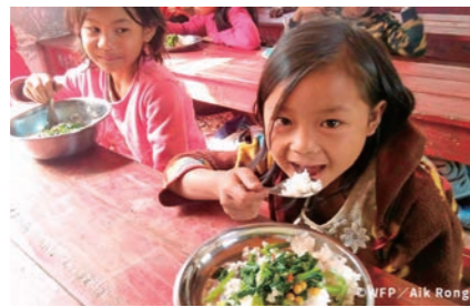
写真は2019年以前のものです

2020年度は、新型コロナウイルスの影響で学校の休校が続いており給食の提供ができませんでした。かわりに、栄養強化ビスケットの配布や、食料購入のための現金支給を保護者らを対象に実施し、子どもたちの栄養不足回遊に役立てられました。