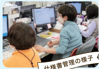
仕様書管理の様子

生協の基準を満たしている商品をお届けできるように、生協で定めた「不使用添加物」が使われていないか、アレルギー表示を含め適切な表示がされているかどうかなど、取り扱い前に仕様書を確認しています。また、包材が法律の基準を満たしていないものなどを、取り扱い前に修正してもらうこともあります。