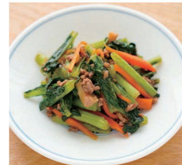
小松菜のさば味噌炒め

うまい! さば味噌煮 (国内水揚げ) 150g(固形量100g) 本体価格 218円 税込価格 235円 次回予定 2月3週