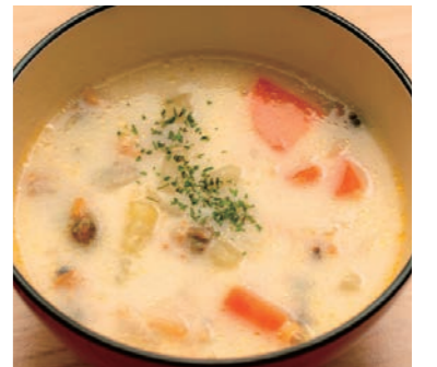
あさりのクラムチャウダー

クリームシチュー (顆粒タイプ) 120g(6皿分)×3 本体価格 288円 税込価格 311円 次回予定 2月3週