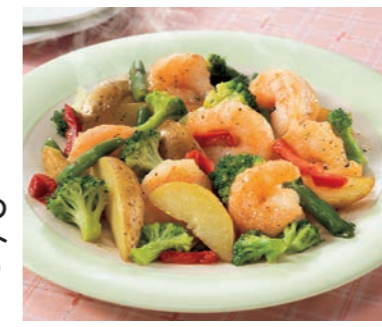
タラのバジルソース

えびと北海道ポテトの 彩りバジルソースセット 凍 245g (200g+たれ) 本体価格 498円 税込価格 537円 次回予定 10月3週