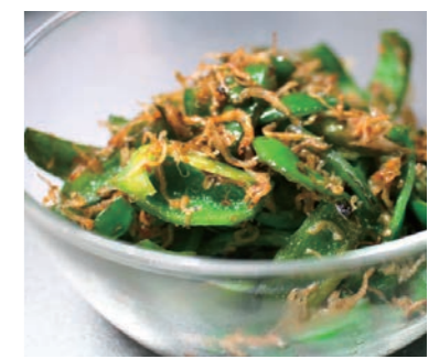
ピーマンとじゃこのふりかけ

ちりめん(うす塩味) 凍 45g 本体価格 298円 税込価格 321円 次回予定 11月1週