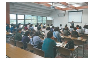
恵那中津支所 ゴールドバック (長野県)

人を大切にする企業である事、そのような所の商品を買えることが嬉しいです。 (岐阜西支所の組合員)