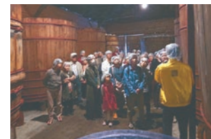
岐阜南支所 野田味噌商店 (愛知県)

いつも買っている商品の製造過程が細かく知れて嬉しかったです。 (中濃支所の組合員)