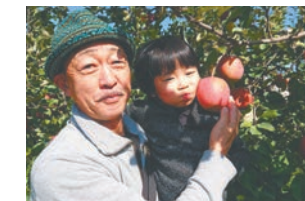
各務原支所 Fエース (長野県)

このような企画に初めて参加しました。りんご農園にも初めて行き、たくさん実ったりんごに感動しました。 (各務原支所の組合員)