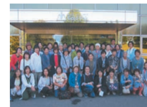
多治見支所 ゴールドバック (長野県)

産地見学を各地域で計画し、278名の組合員がメーカーを訪れました。生産者さんの生の声を聞き、見学することで商品の良さを改めて実感することができました。