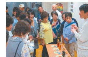
岐阜西支所 内堀醸造 (長野県)

商品や原料についてしっかり学習も出来たし、こだわりも感じました。 (西濃支所の組合員)