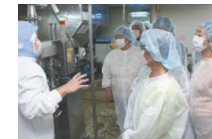
西濃支所 一正蒲鉾 (滋賀県)

このような企画に初めて参加しました。りんご農園にも初めて行き、たくさん実ったりんごに感動しました。 (各務原支所の組合員)