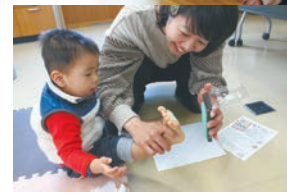
中濃支所 手形アート