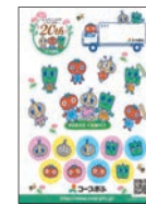
キャラクターシール