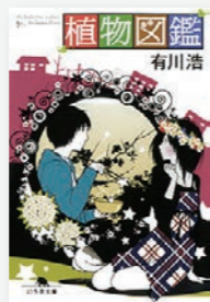
植物図鑑 / 幻冬舎 / 有川浩

映画にもなりましたが、いつも見慣れている野草にも、実はしっかり名前があり食べられる...ということを知り、驚きました。恋愛物語ですが、植物の勉強になるお話です。