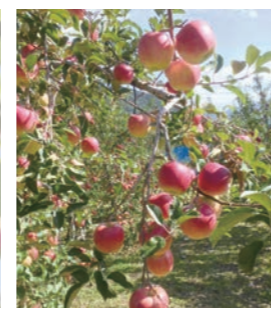
飛騨・益田エリア合同企画りんごde交流会

※「栽培自慢」は、生協独自の栽培自主基準を満たした農作物認証制度です。栽培状況や農業の使用回数についての計画や記録書類を点検し、認証委員会で承認します。つまり、いつどのような肥料や農薬を使用したのかわかる、農場や生産者が特定できる「顔の見える」農産物です。