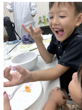
(岐阜市 うさぎばんださん)

● 東海コープ商品安全検査センター夏休み親子実験教室「固めて楽しい手作りラムネ&アイス」で、ラムネづくりが楽しすぎた2人でした。 (岐阜市 うさぎばんださん)