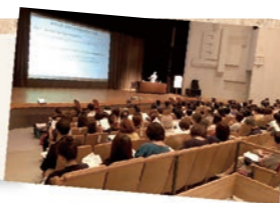
2019年度助成団体「ぎふ場面緘黙親の会～stand by me～」さんの講演会