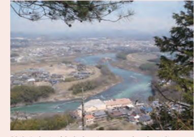
鳩吹山(可児市)中腹から見下ろす景色です。

「富士山登頂」を目指して友人と一緒に5年くらい前から始め、無事目標を達成しました。山頂からの朝日、夕焼け、澄んだ空に感動!山登りがやめられなくなり、今も夏山を楽しんでいます。