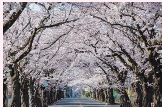
富岡町 夜の森の桜並木