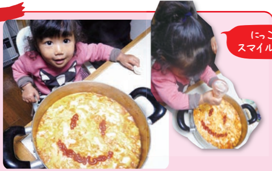
にっこりスマイル〜♪