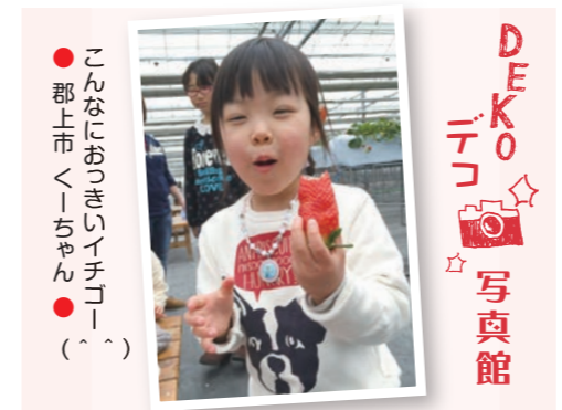
● こんなにおっきいイチゴ ( ) ● 郡上市くーちゃん ●