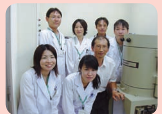
検査担当とともに

商品安全検査センターホームページ http://www.tcoop.or.jp/kensa/index.htm