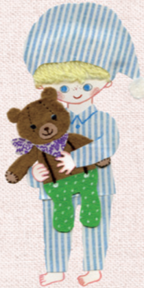
病気で輸血を受けた 患者さんの家族から