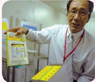
▲それぞれの成分の特性に合わせた方法で保管されます。期限をすぎた血液は使用できません。

調理例：ほうれん草入り卵焼き、あさりのクリームスープ、大根おろし納豆、レバーと小松菜炒め、切り干し大根とツナの煮物 など