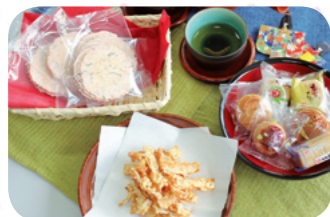
グループ 宅配 ステーション 「みんなとのんびりお茶セット」

いつものメンバーでちょっとのんびりおしゃべりをするというコンセプトの、バラエティに富んだ食べやすいお菓子を集めました。