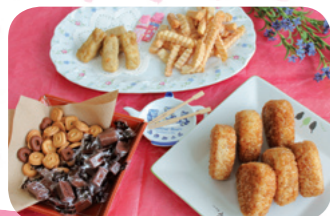
店舗 「えらんでミニランチセット」

いつものメンバーでちょっとのんびりおしゃべりをするというコンセプトの、バラエティに富んだ食べやすいお菓子を集めました。