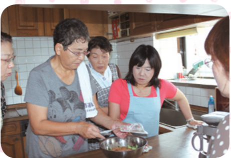
みんなでわいわいクッキング。「簡単にできるのね〜」