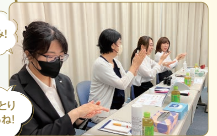
▲完成した商品をお試し!