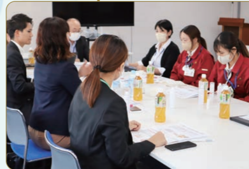
プロジェクト始動!