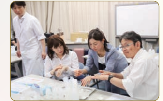
▲自分だけのオリジナル美容液作りにチャレンジ