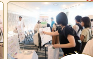
▲25周年記念イベントにて