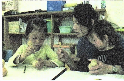
電気もつけるのが楽しみです。