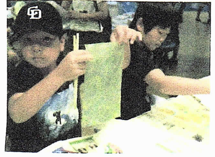
マーブリング体験をしました。 工作も楽しいね!