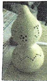
ひょうたんは岐阜県養老産です。