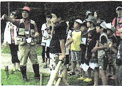
川の中には、知らない生きものがたくさんいました。 知りたいことがふえました!