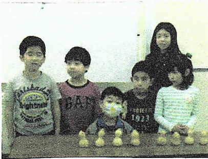
がんばって作りました!