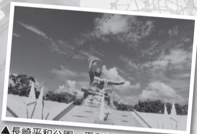
▲長崎平和公園 平和祈念像