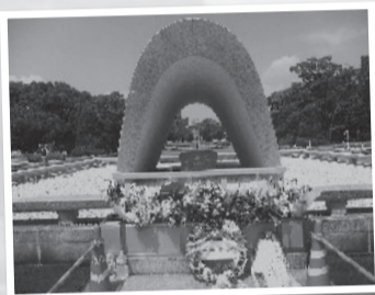
▲広島平和記念公園 献花