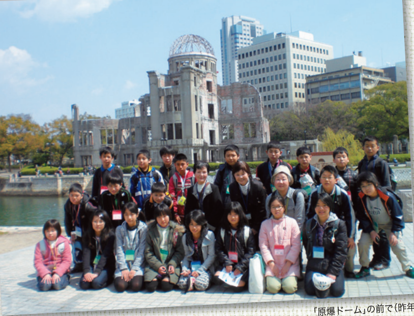
「原爆ドーム」の前で(昨年)