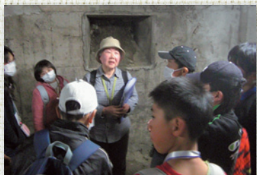
宮城県の地下壕(昨年)

少年・少女ヒロシマの旅とは、 春休みに、友だちも思い出もいっぱいあって、 平和の尊さを、みんなで学ぶ企画です。