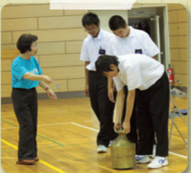
水がめを持ち上げる様子

養老町立高田中学校では、今年の一学期に『貧困』について学びました。そこで「私たちにできることはなんだろう...」という意見が出されました。世界の現状を知り、自分たちにできることは何かを考えたいと、今回岐阜県ユニセフ協会に「出前学習会」を依頼されました。学習会のDVDでは、労働を強いられる子どもたちや、重い水がめを担ぎ、何時間も歩いて水を運ぶ子どもたち、水溜りのように茶色く濁った水で口をすすぐ人々等、日本とは大きく違う、世界の現状を見ました。また、地雷のレプリカに触れたり、実際に使われている水がめを持ってみることで、世界の子どもたちの現状を感じていただけたようでした。