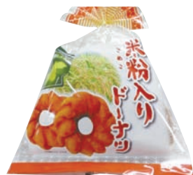
17号商品案内デビュー 7個入り 298円

「お母さんの思いは甘さひかえめ、子どもには物足りないのでは？」など話し合い、総代会議の場で総代さんに試食していただき、味、食感について8割の方に支持をいただき決定しました。 ハツシモの米粉は商品全体に約5%を使用して、お米をあまり感じない「おやつ」や「お茶うけ」に甘さを控えたドーナツができました。また、ぜひ米粉について知っていただきたいと商品名やパッケージに「米粉」をアピールしました。 ぜひみなさんご利用ください。